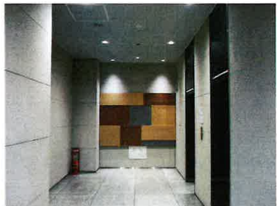
1 階エレベーターホール