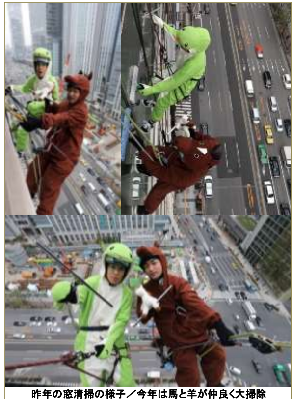
昨年の窓清掃の様子／今年は馬と羊が仲良く大掃除

当日のご撮影場所は、①屋上 ②15階のロビー窓側 ③1階道路の3カ所をご用意します。清掃員は皆様のご要望に沿い30cm単位でゆっくりと降り、撮影に出来る限りご協力いたします。