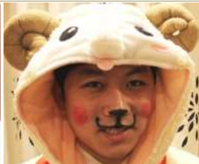
メイクなど細部にまでこだわり!